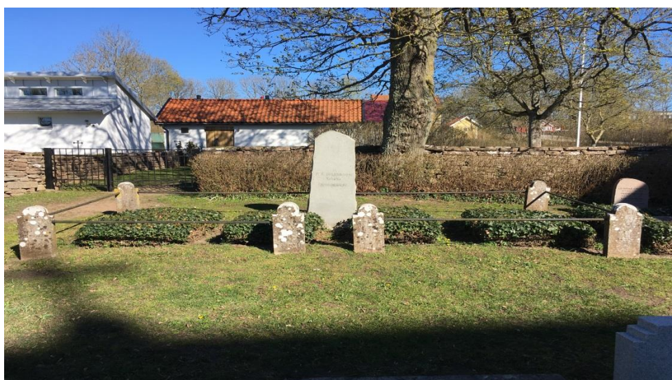
Familjegraven på Glömminge kyrkogård.