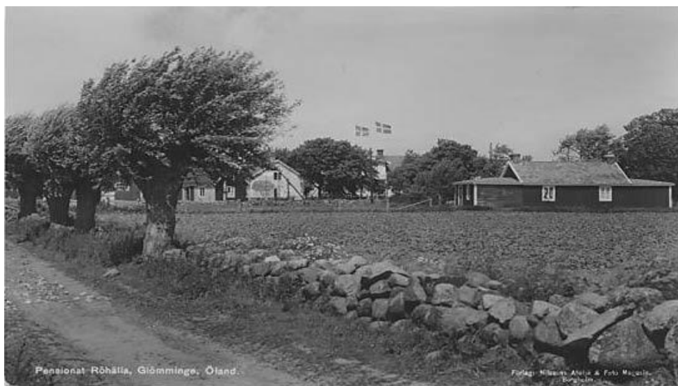
Vägen ner mot Röhälla från Glömminge.